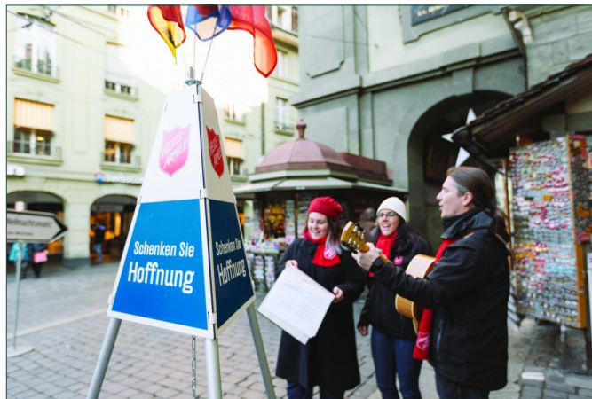
Die Heilsarmee ist mehr als die Topfkollekte im Advent.